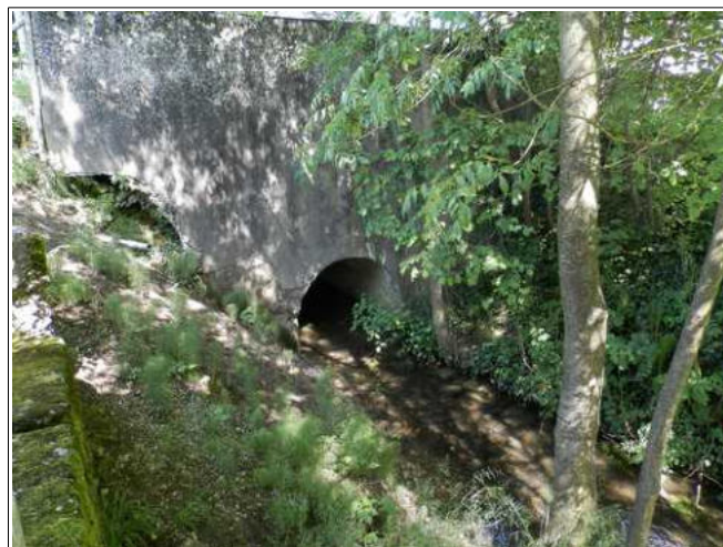
Franchissement de la voie communale du hameau de CHASSIN. On notera l'ouverture étroite du pont.

A l'aval de L'ÉTANG DE CHASSIN, le ruisseau franchit la voie communale menant au hameau de CHASSIN. Il quitte l'emprise de la zone humide et dispose alors d'un champ d'inondation de largeur très réduite du fait de l'étroitesse de la petite combe qu'il emprunte. La voie communale peut entraver ses écoulements, notamment en cas d'embâcle au niveau de son pont. A l'aval de cette route, il peut déborder localement sur le terrain d'une propriété bâtie.