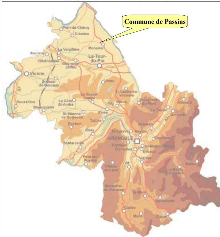
Figure n°1 Localisation de la commune de PASSINS

La commune de PASSINS se situe dans le NORD-ISÈRE, à une quinzaine de kilomètres au nord-est de BOURGOIN-JALLIEU et 13 kilomètres au nord de LA TOUR DU PIN. Elle est limitrophe avec les communes d'ABANDON, COURTENAY, SOLEYMIEU, SERMÉRIEU et MORESTEL. Intégrée à la communauté de communes du PAYS DES COULEURS, elle dépend administrativement du canton de MORESTEL et de l'arrondissement de LA TOUR-DU-PIN.