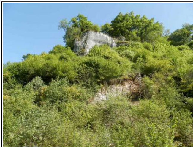
Affleurement rocheux de quelques mètres de hauteur dominant le MARAIS DE L'EPAU.

Le substratum calcaire forme quelques escarpements rocheux au nord de la commune ou affleure sous la forme de talus rocheux. La partie sommitale du versant dominant le MARAIS DE EPAU présente ainsi un cordon rocheux de quelques mètres de hauteur d'où peuvent se détacher des blocs isolés de taille réduite (généralement moins de 1 m 3 ). Les blocs peuvent se propager jusqu'à proximité du chemin d'exploitation bordant le marais. Le profil du terrain ne leur permet pas de s'étendre au-delà. La zone potentiellement exposée est entièrement naturelle (boisement et friche).