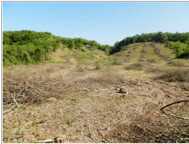
Combe au nord de la commune débouchant dans le MARAIS DE L'ÉPAU.