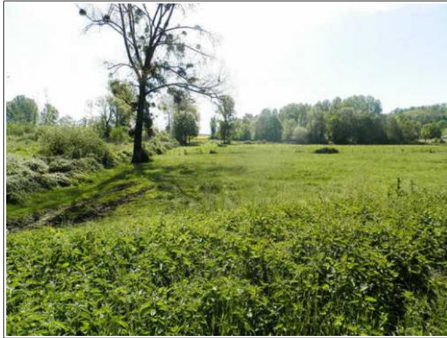
Vue générale du lieu-dit RADIS où le ruisseau de PASSINS prend sa source. On notera la planéité du terrain et à gauche de la photo les traces de roue laissées sur le sol par un tracteur.