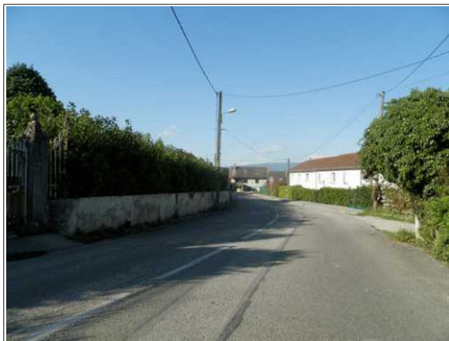
L'eau peut suivre la RD244a et se diffuser au niveau du bourg en empruntant divers passages.