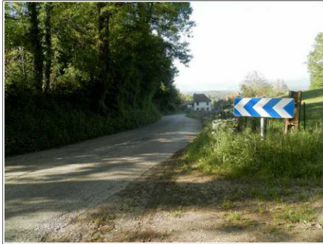
Axe d'écoulement au sud du bourg de PASSINS. L'eau peut se concentrer sur la RD244a puis atteindre le bourg.