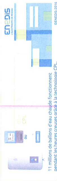
11 millions de ballons d'eau chaude fonctionnent pendant les heures creuses grâce à la technologie CPL.