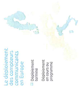
Le déploiement des compteurs communicants en Europe

Selon une étude du Cabinet Navigant Research, le nombre de compteurs communicants dans le monde passera à presque 1,1 milliard en 2022. L'Europe, le Canada, les Etats-Unis, la Chine sont tous dans une démarche de déploiement de compteurs communicants.